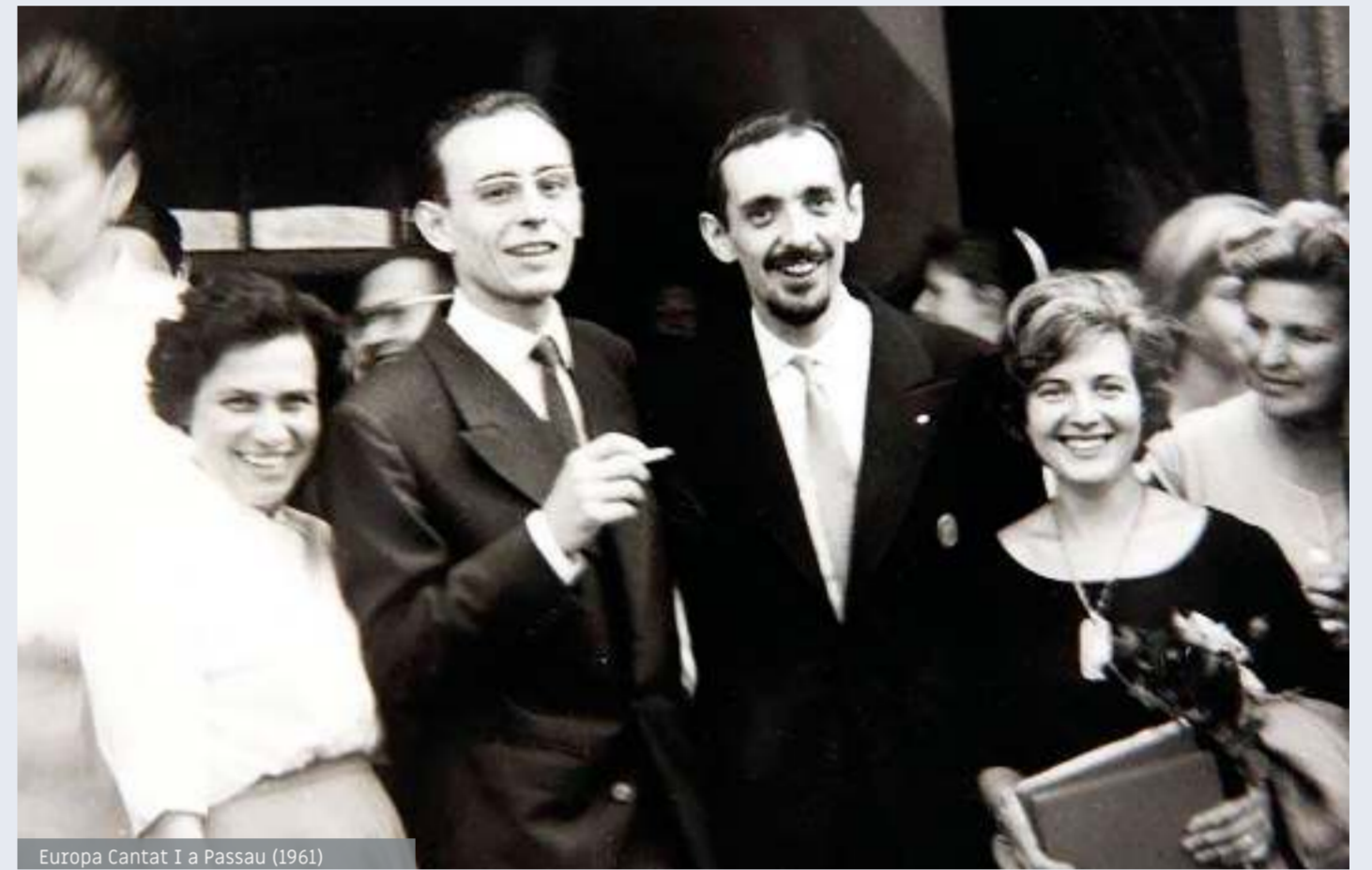
Europa Cantat 1 a Passau (1961)

«Des del final de la guerra, amb la seva Coral Sant Jordi, [l'Oriol] ha entrat en el concert europeu, no per fer-se veure ni per destacar, sinó per fer participar de la música del seu país. Només es pot ser europeu afirmant l'arrelament als propis valors regionals o nacionals. És per això que els cantaires d'Europa Cantat han reconegut el patrimoni de Catalunya com a propi.