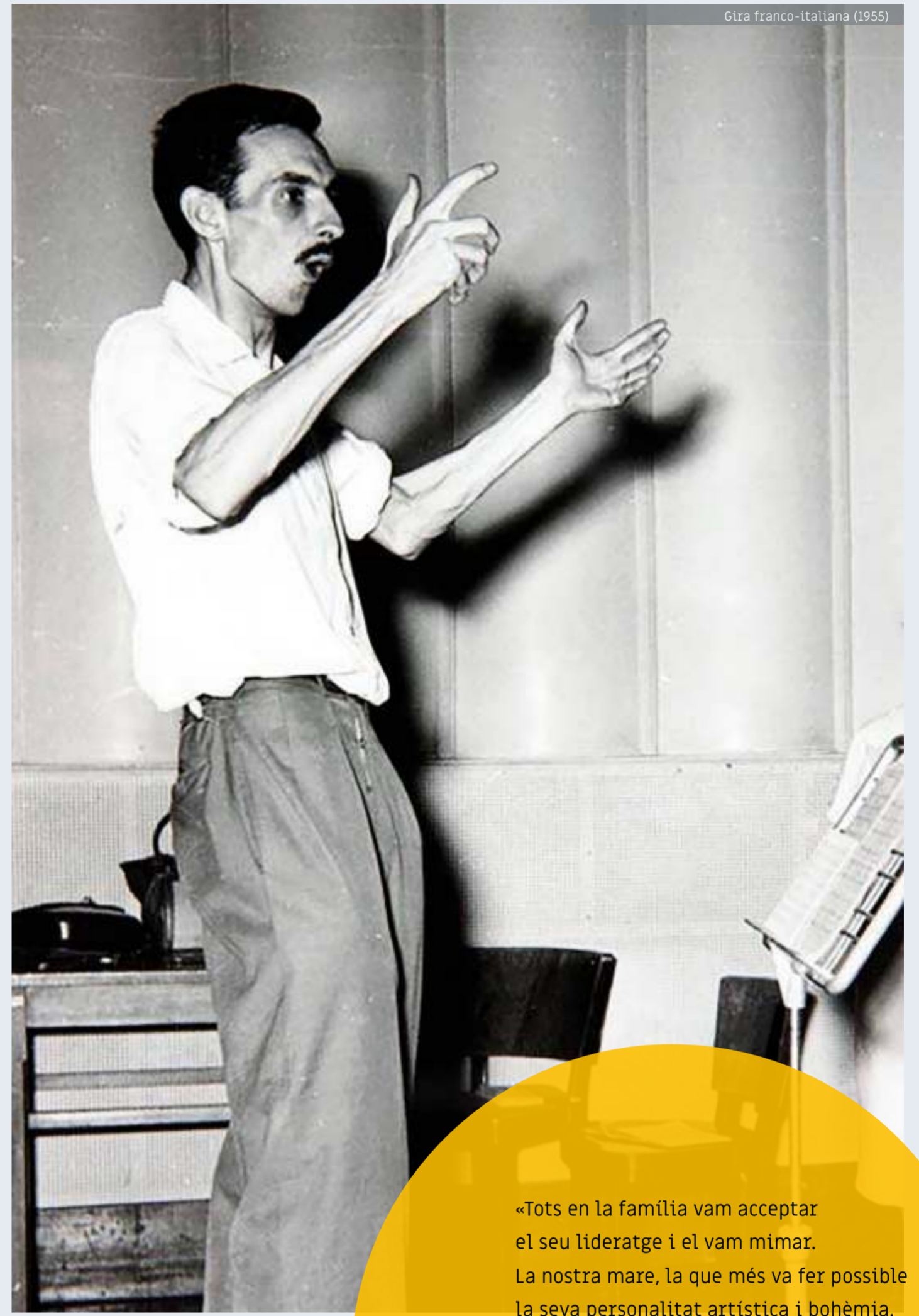
Gira franco-italiana (1955)