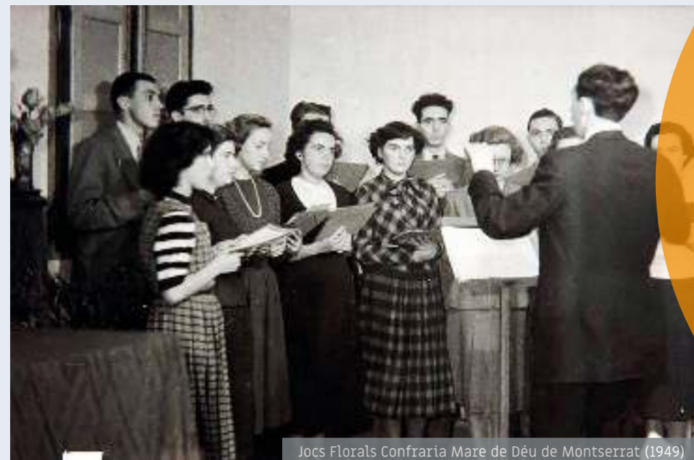
Jocs Florals Contrària Mare de Déu de Montserrat (1949)

«La Coral ho ha significat tot per a mi;