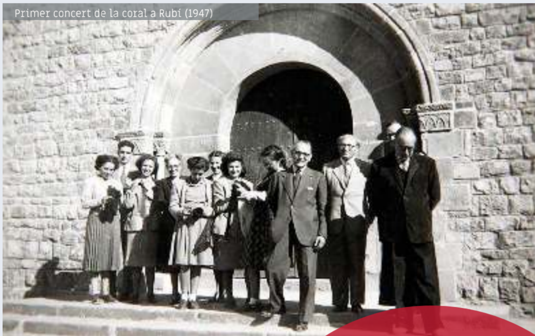
Primer concert de la coral a Rubí (1947)

El 30 de novembre de 1947, va dirigir una colla d'amics que, amb el nom de Schola Sant Jordi, van oferir un petit concert a Rubí, amb motiu de les festes de Santa Cecília. Fou la primera audició de la futura Coral Sant Jordi.