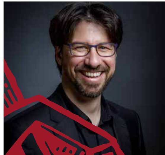
DIRECTOR TITULAR DE LA CORAL SANT JORDI

Ha treballat amb el cor Lieder Càmera com a correpetidor i subdirector del 2008 al 2014. Ha estat pianista acompanyant del Cor Infantil de l'Orfeó Català i pianista del Cor Jove Nacional de Catalunya (2013-2017) i director de la Coral Sinera dels Lluïsos de Gràcia (2012-2019). L'any 2001 va fundar el Cor Aglepta, cor femení que dirigeix des d'aleshores i actualment també és pianista i director del Cor Infantil Sant Cugat i, des de l'any 2016, director de la Coral Sant Jordi. El setembre de 2022 assumeix la codirecció del Cor Jove de l'Orfeó Català.